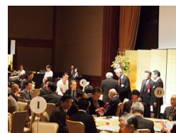
160 名を超える方々にご参集頂きました